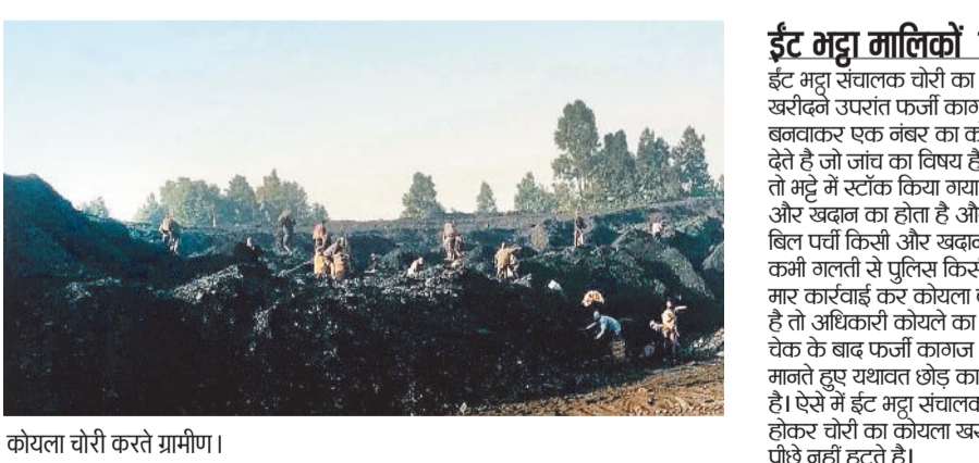
कोयला चोरी करते ग्रामीण।

टंड बढ़ते ही एक बार फिर गायत्री खदान कोयला चोर गिरोह सक्रिय हो गए हैं जो रोजाना बड़ी मात्रा में कोयला चोरी कर आसपास क्षेत्र के गमला व ईंट भट्टे में चोरी का कोयला खपा रहे हैं। जिस तरह से गायत्री खदान से हर रोज तीन हजार टन से ऊपर कोयला उत्पादन कर रही है ठीक उसी प्रकार कोल माफिया सक्रिय होकर बड़ी मात्रा में कोयला चोरी कराकर अवैध रूप से कमाई कर रहे हैं, जो प्रबंधन की उदासीन सुरक्षा व्यवस्था को प्रदर्शित करता है।