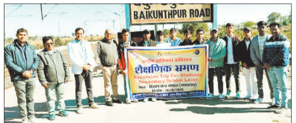
भ्रमण के लिए रवाना होते छात्र।