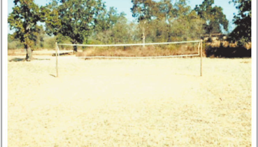
बैकुण्ठपुर। ग्रामीण क्षेत्रों में कई जगहों पर खेल पैरामियों को अच्छा खेल मदान नहीं मिल पाता है, लेकिन इसका विवल्प भी तलाश लेते हैं। सोनहत जनपद के प्रकाशपुर नवापारा में ढालीबाल के लिए युवाओं ने खेत में नेट तानकर अभ्यास करते हैं।