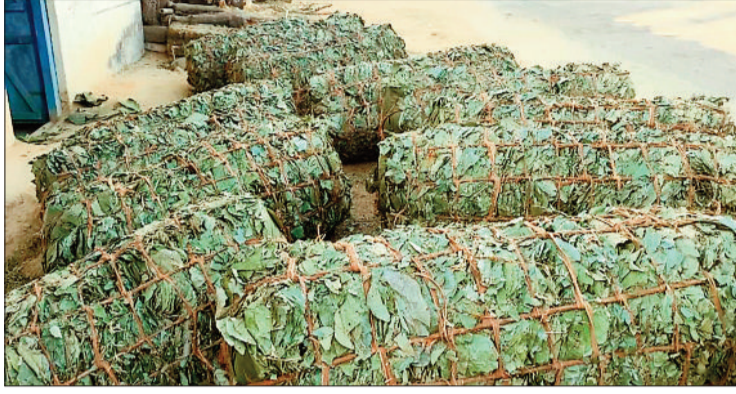
तोड़ गए माहुल के पत्ते।