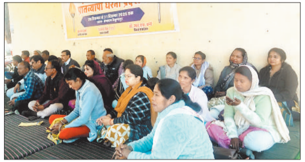
धरना पर शामिल अधिकारी-कर्मचारी।

जानकारी के अनुसार माहुल पत्तों का तो वैसे दोना-पत्तल बनाने में ज्यादा उपयोग किया जाता है, लेकिन कोरिया जिले के कई ग्रामीण क्षेत्रों में कुछ लोग अनाज रखने के लिए छोटे पात्र घड़ा के आकार का भी बनाते हैं। माहुल पत्ता चौड़ी होने के साथ मजबूत भी होता है, कच्ची हालत में पत्तों से छोटे साइज के पात्र भी बनाते हैं जो सालों साल टिकते हैं। जिले के सोनहत जनपद क्षेत्र में कई ग्रामीण परिवारों के यहां माहुल पत्तों से बने छोटे पात्र देखे जा सकते हैं।