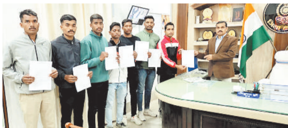
नियुक्ति पत्र सौंपते एसपी।

बैकुण्ठपुर। जिला पुलिस बल आरक्षक संवर्ग चयन प्रक्रिया वर्ष 2023-24 के अंतर्गत पुलिस महानिरीक्षक सरगुजा रेंज सरगुजा द्वारा आरक्षक संवर्ग के पद के लिए 9 दिसंबर को चयनित अभ्यर्थियों की अनुमोदित सूची पुलिस अधीक्षक, कोरिया कार्यालय को प्राप्त हुई।