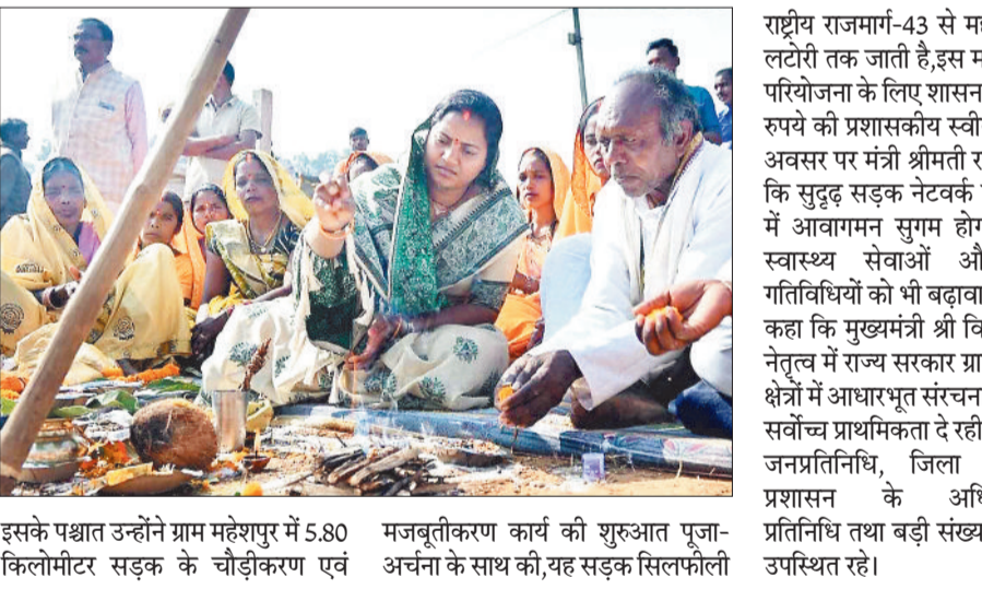
इसके पश्चात उन्होंने ग्राम महेशपुर में 5.80 किलोमीटर सड़क के चौड़ीकरण एवं