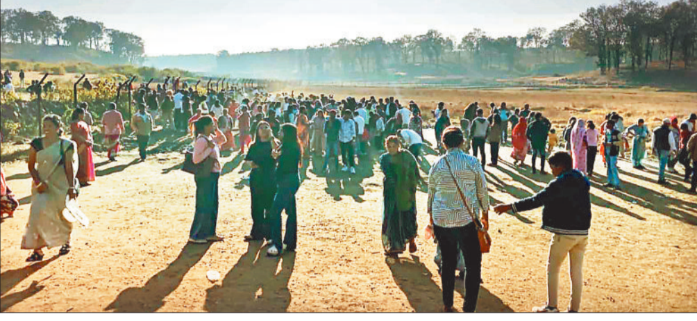
दलदली में पर्यटकों की भीड़।